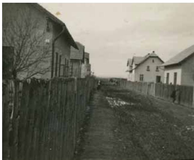
Ulice (dnes) Nádražní před rokem 1945 – po levé straně první dům č.p. 111, 112, 113, 114, na pravé straně odzadu 133, 134, 135

č.p. 95 – bez určení (nyní ul. Havlíčkova)