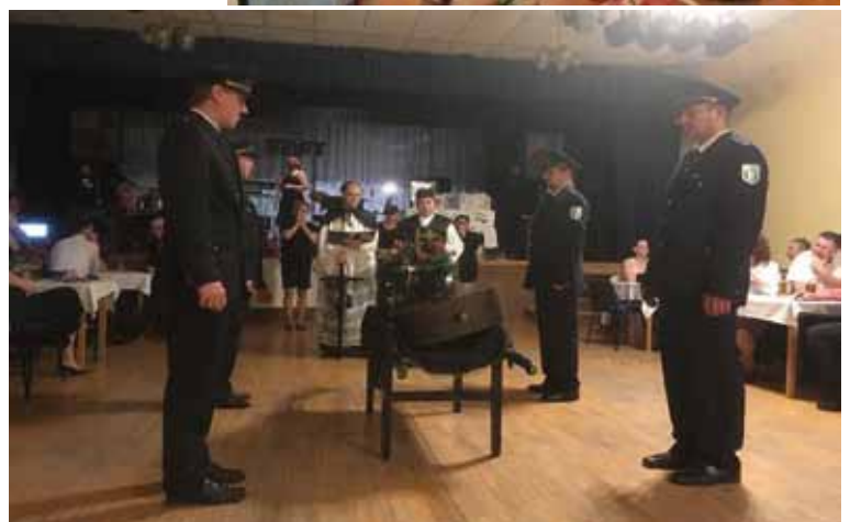
Pochování basy (SDH Štítina)