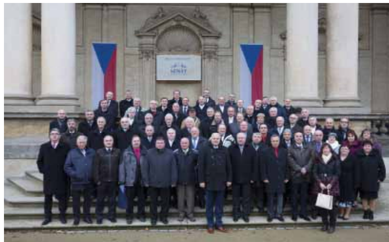
Společná fotografie starostů s místopředsedou Senátu Šestákem

Pamětní list, který starostové převzali, je vyjádřením díky Senátu Parlamentu ČR za jejich práci. Připojený grafický list vytvořil přední český umělecký knihař a grafik Ladislav Hodný.