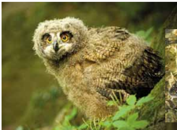
Výr velký (mládě)

Petra Valentová, foto ilustrační (zdroj internet)