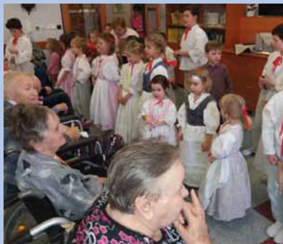
Martin Paroulek, foto autor

Naše poděkování patří všem, kteří se na této krásné akci podíleli a zpřijemnilo adventní předvánoční dobu obyvatelům Domova Bílá Opava a Domova pro seniory sv. Hedviky – Kravaře.