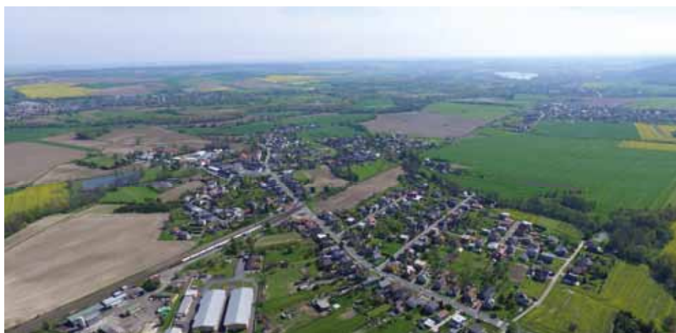
Vaše MAS Opavsko

Více informací a kontakty na manažery MAS, kteří s vámi rádi proberou jakékoli podněty a dotazy, naleznete na webových stránkách: www.masopavsko.cz