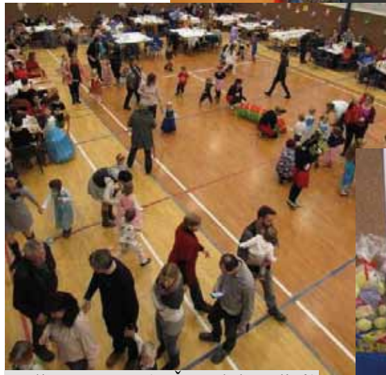
Maškarní ples (MŠ a Klub rodičů)