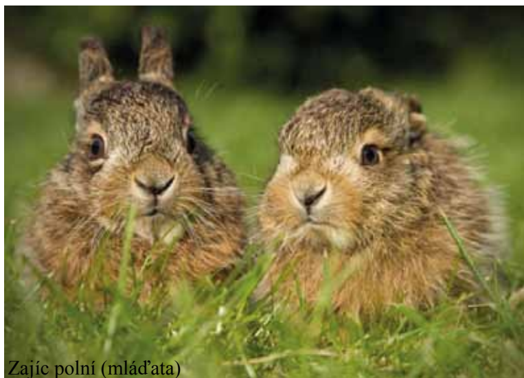
Zajíc polní (mláďata)

začínají okusovat třeba větvičky, stále potřebují velice specifické mléko, které je velmi bohaté na tuky a bílkoviny a v lidské péči se velice špatně nahrazuje. Většina zajíčků brzy hyne. A málokterý odchovaný se dá vypustit zpátky. Pokud na mládě v přírodě narazíte, neberte ho! Dokonce ani pokud ho oslintá váš pes, není to důvod k odnesení mláděte. Vždy to nejprve konzultujte s ošetřovateli v záchranné stanici.