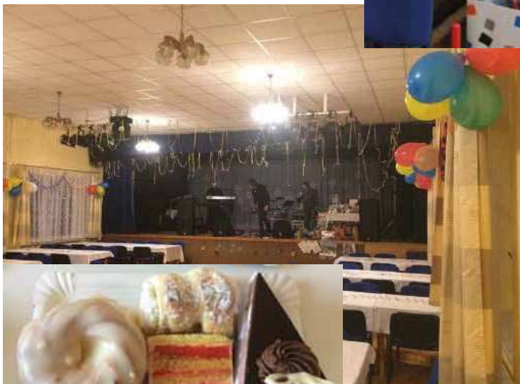
Chovatelský ples (Svaz chovatelů)